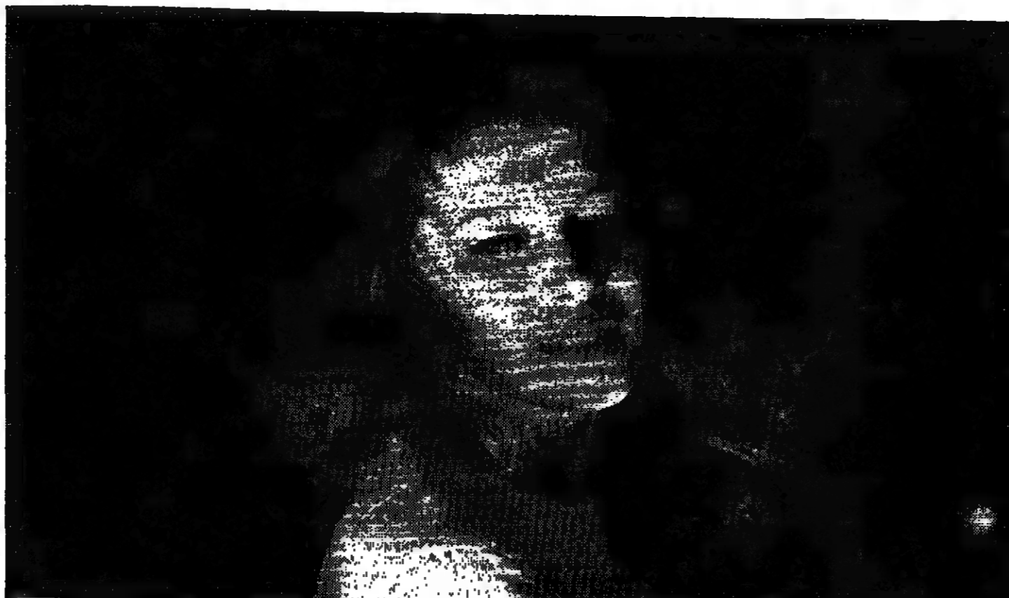
Une scène de Les Longs Adieux, de Kiria Maratova (1967), dont les films furent sensation à Locarno. Auteur de quatre œuvres depuis vingt ans, toutes interdites ou mutilées, elle n'a jamais rencontré son public.

Le Festival de Locarno, en Suisse - le plus ancien après celui de Venise, - a toujours un gros succès public. Cette année, il a mis évidence la crise traversée par le jeune cinéma.